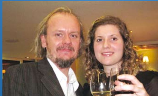
El gran maestro Stuart Conquest, la gran maestra mundial Jovanka Houska

El gran maestro Stuart Conquest, el muy respetado campeón británico de 2008 y director del torneo del FESTIVAL DE AJEDREZ DE GIBRALTAR TRADEWISE, el mejor abierto del mundo, también ha accedido a venir durante la celebración del torneo y a dar una clase maestra y análisis.